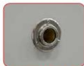
Foro passante laterale di 25 mm per l'installazione di sensori all'interno della camera