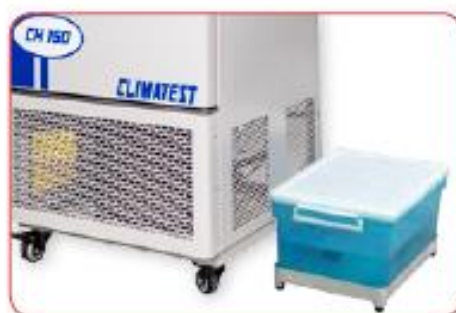
Contenitore esterno per l'acqua di alimentazione del generatore di vapore, fornito di serie