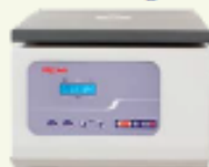
Modello R-10M 1 x Codice 40000052