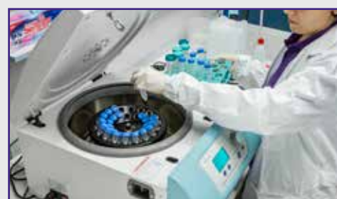
Altezza ideale alle operazioni di carico e scarico dei campioni