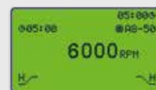
Ciclo di centrifugazione