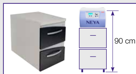
Mobile con ruote piroettanti. Codice 40101802