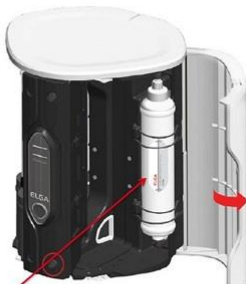
Cartuccia di pretrattamento